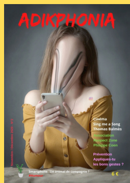
N°2 Novembre/décembre 2020