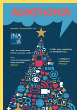
N°4- Novembre / Décembre 2021