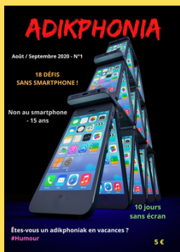
N°1 Août/Septembre 2020

Mon abonnement démarre à partir du numéro N°1 - N°2 - N°3 N°4