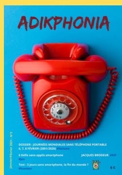
N°3 - Janvier/Février 2021