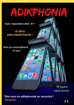
N°1 Août/Septembre 2020

Adikphonia est uniquement en version papier. Vous pouvez décider le début de votre abonnement à partir du N°1, N°2, N°3