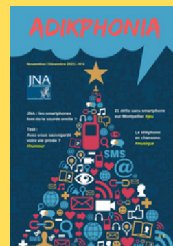
N°4 Novembre / Décembre 2021

Megacom-Ik - Bât 5 - 18 rue Wurtz - 75013 Paris - Tél : 09 53 92 53 17 - philmarso@yahoo.fr Sarl de Presse au Capital de 305 € - R.C Paris : 342 568 474 00031 - APE : 5811Z Numéro de TVA intercommunautaire : FR37342568474 - Megacomik.fr