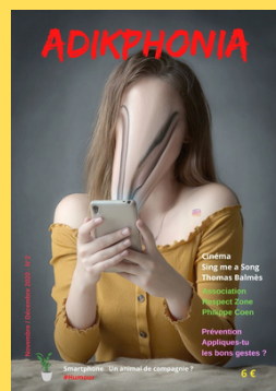
N°2 Novembre/Décembre 2020