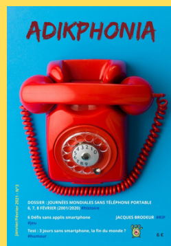
N°3 - Janvier/Février 2021